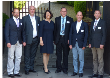
Bundesarbeitsgemeinschaft Deutschland zu Pferd

16. - 17. Mai: 3. nationale Pferdetourismuskonferenz in Burgbrohl, RLP