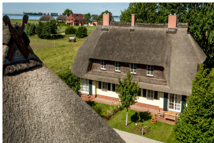
Ansicht einiger Ferienwohnungen unter Reet auf dem Rügen-Ferienhof

Unser Reitanbieter, der Rügen-Ferienhof auf der Rügeninsel Ummanz ist einer der zehn beliebtesten Ferienhöfe in Deutschland . Zu diesem Ergebnis kam das Bauernhof-Urlaubsportal Landreise.de, das zum 22. Mal bei den Gästen nachgefragt hatte, welche Höfe auf deren Beliebtheitskala ganz oben stehen. Die Landurlauber gaben dazu von September 2016 bis August 2017 ihre Stimme ab. Der kinderfreundliche Rügen-Ferienhof hat die Gäste unter anderem mit