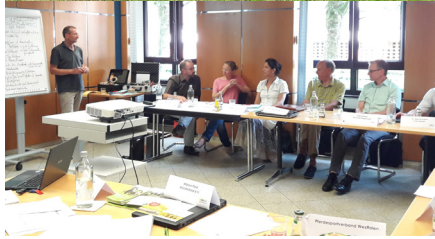
Bundesreitsportgemeinschaft Deutschland zu Pferd

Im Rahmen des Projekts „Qualitätsmanagement für Rad- und Reitrouten in der Pilotregion Münsterland“ haben Vertreter von Pferdetourismusdestinationen aus Deutschland, FN, VFD und Kreisvertretern des Münsterlandes im Juni und September einen ersten Entwurf und ersten Praxistest zu einem deutschlandweit anerkannten Zertifizierungssystem für touristische Reitrouten erarbeitet.