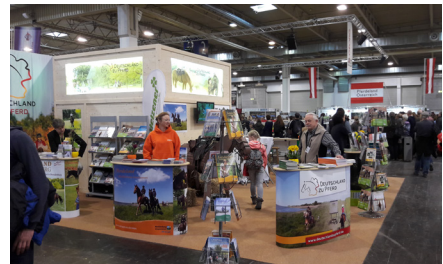
Bundesarbeitsgemeinschaft Deutschland zu Pferd

18. - 26. März: das Pferdeland MV zu Gast auf der Pferdemesse, der EQUITANA