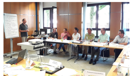
Auseinandersetzung, Analyse und Auswertung zu den erarbeiteten Typen und Kriterien für Reit- und/oder Fahrrouten mit den Teilnehmern des Qualitätsmanagements