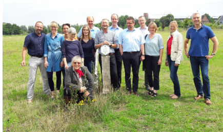
Theorie und Praxis ganz nah beieinander - Teilnehmer zum Qualitätsmanagement für Rad- und Reitrouten in der Pilotregion Münsterland

Für Radfahrer und Wanderer gibt es sie schon seit Jahren – Kriterien für die Qualitätsrad- oder –wanderrouten. Ausgewiesene Qualitätsreitrouten soll es zukünftig auch deutschlandweit geben.