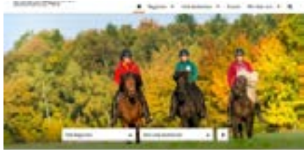
Startseitenansicht der Internetseite deutschlandzupferd.de

Die Qualität der neuen Bundespräsentation besteht darin, dass potenzielle neue Gäste sich einen Überblick zum Reiten in ganz Deutschland verschaffen, sich von Regionen inspirieren lassen und Pferdewelten fachlich fundiert erklärt bekommen.