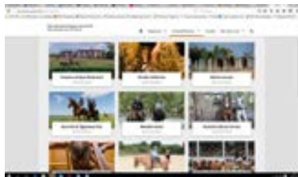
Urlaubsthemen auf deutschlandzupferd.de

Die multifunktionale Deutschlandkarte mit Benennung, Verortung und Verlinkung der Regionen sowie die unkomplizierten Schnelleinstiege in wichtige Urlaubsregionen und Urlaubsthemenwelten stellen eine optimale Darstellung der relevanten Inhalte dar und stellen höchste Benutzerfreundlichkeit zur Verfügung, um den potentialen Gast für den Pferdetourismus in Deutschland zu gewinnen.