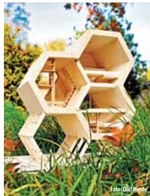
Modell eines neuen Baumhauses der Grünen Wiek in Beckerwitz

Informationen und Buchungsmöglichkeit unter www.gruenewiek.de oder ☎ (0 38 42) 86 03 62