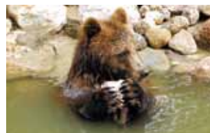
Erfrischungsbad bei den ersten Sonnenstrahlen

Der Wild- und Landschaftspark in Güstrow bietet jede Menge Abenteuer für große und kleine Naturfreunde. Im Eingangsbereich befindet sich bereits eine fantastische Unterwasserwelt mit einer 30 Meter langen Aquarienwand und einem AQUA-Tunnel, der durch eine Flusslandschaft führt.