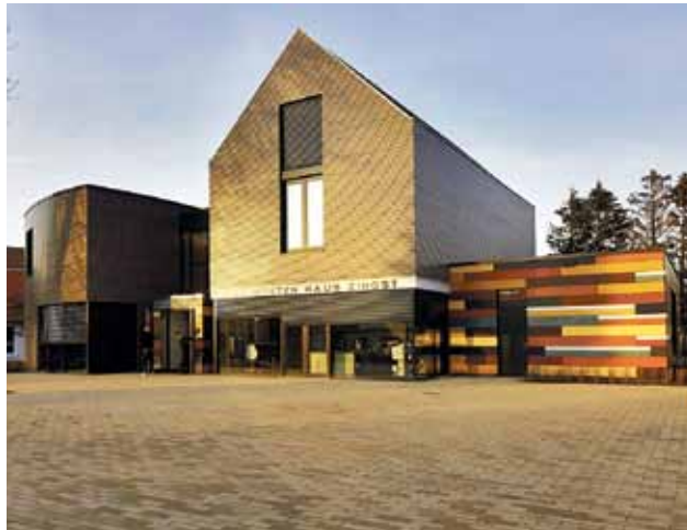
Das Max Hüntten Haus im Ostseeheilbad Zingst

www.hotelalteschule.de , www.hotel-hanseatic.de , www.auf-nach-mv.de/genussreich