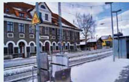
Der Bahnhof Schwaan im Winter 2012