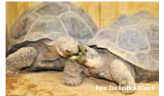
Das DARWINEUM im Rostocker Zoo lockt ab Spätsommer 2012

Das Darwineum vereint Geschichte, Mensch und Tier unter einem Dach. Es bietet eine einzigartige Kombination aus einer lebendigen zoologischen Sammlung und musealen Ausstellung. Mit dem Darwineum erhalten zugleich die Rostocker Menschenaffen und 40 weitere Tierarten ein neues Zuhause. Ebenso wird es eine begehbare Anlage für Kattas geben. Bereits am Eingang begrüßen