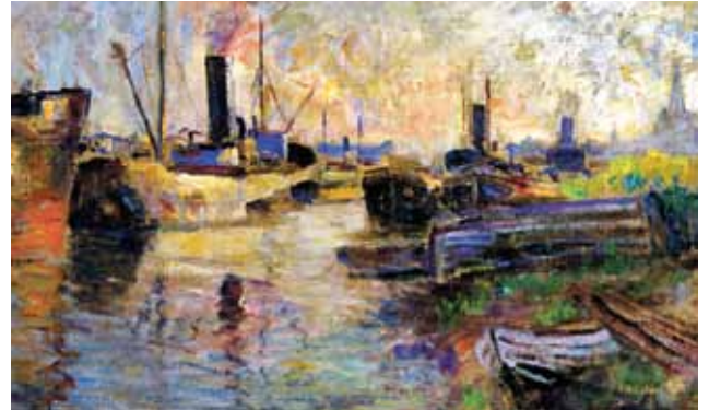
Otto Tarnogrocki, Hafenszene, Stadt Schwaan

Die Kunstmühle Schwaan wurde Ende Oktober 2002 eröffnet. Die Gemäldegalerie