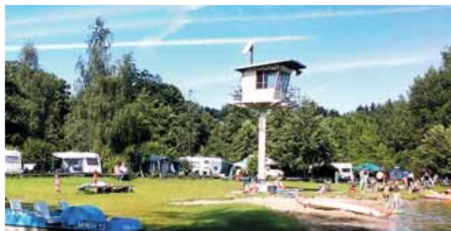
Campingpark Zuruf am Plauer See

Damit es für Sie einfacher ist, die Campingplätze zu finden, die speziell auf das Thema Familie mit Kindern ausgerichtet sind, hat der Verband für Camping- und Wohnmobiltourismus Mecklenburg-Vorpommern e.V. gemeinsam mit der BVCD Camping-Akademie unter dem Motto „Campingurlaub passgenau“ ein Kennzeichnungssystem entwickelt, das Ihnen auf einen Blick zeigt, was der Campingplatz zu bieten hat. Im Campingkatalog können Sie sich umfassend informieren. Folgen Sie einfach diesen Piktogrammen und finden Sie Ihr Familien-Paradies.