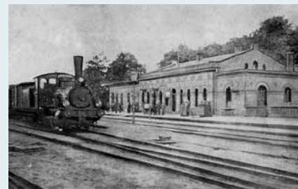
Der erste Zug in Schwaan um 1850