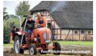
Alte Zeiten, alte Technik – Spaß für jedermann

Das authentische Bauerndorf aus vergangenen Tagen und beliebte Ausflugsziel am Fuße der Halbinsel Fischland-Darß-Zingst präsentiert sich mit einer Reihe familienfreundlicher Angebote. Neben vielen Mitmachangeboten wie „Ackern mit Pferd und Traktor“, „Brotbacken im historischen Holzofen“ und „Spielen wie zu Omas Zeiten“ warten auf dem Museumshof neue Kinderattraktionen. Drei Themenspielplätze heißen große und kleine Besucher herzlich willkommen genau wie die neue Göpelscheune, die zum Spielen und Verweilen ihre Pforte eröffnet. Ebenso neu ist die Möglichkeit, seltene Kräuterpflanzen aus dem Museumsgarten zu erwerben. In der Handwerker-scheune präsentieren sich traditionelle Gewerke, es kann auch selbst Hand angelegt werden. Die saisonalen Mitmachangebote „Wertvolle