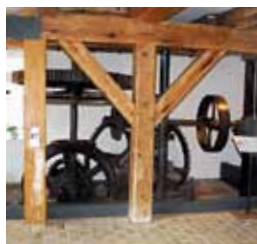
Die historische Wassermühle – Kunst- und Technikmuseum zugleich