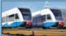
Die modernen Dieselmotoren der UBB gehören zum Inselbild wie weiße Villen und endloser Sandstrand. Auch hier gilt das Mecklenburg-Vorpommern-Ticket