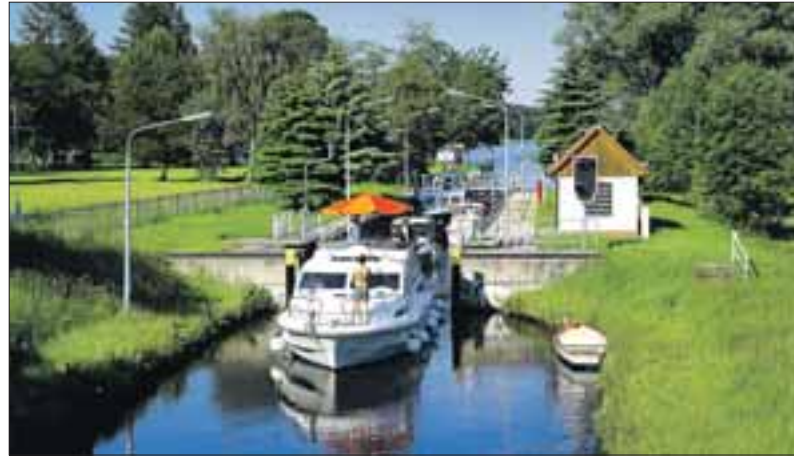
Boote in der Schleuse in Himmelpfort am Stolpsee

Große Rundtour zwischen Brandenburg und Mecklenburg