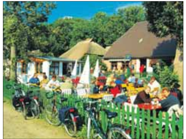
Fahrrad-Pause in einem idyllischen Biergarten auf Rügen

Rügen komplett mit dem Rad zu entdecken, kann sicherlich leicht zu einer Herausforderung werden – immerhin ist die Insel etwa 1.000 Quadratkilometer groß. Mit Fahrrädern, die mit einem Elektromotor das Treten unterstützen – so genannten Pedelecs – lässt sich allzu schweren Beinen auf längeren Touren leicht vorbeugen. Als jüngste „movelo“-Region bietet nun auch Rügen die Möglichkeit, diese Pedelecs an 25 Stationen auf der Insel zu leihen oder bei Bedarf den Akku zu wechseln. Damit können auch ungeübte Radler problemlos Etappen bis zu 60 Kilometer schaffen und Rügen ganz entspannt auf zwei Rädern erkunden.