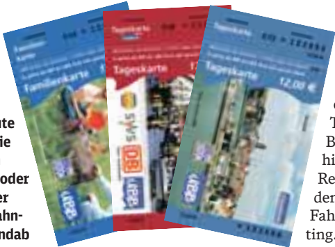
Achtung: Das Fahrkartensortiment der UBB kann süchtig machen

❖ Du hast den Farbfilm vergessen, mein Michael!* In den 70er Jahren war das am Ostseestrand noch ein echtes Problem. Wer heute am Strand von Usedom die Digitalkamera vergessen hat, kauft sich eine neue oder – ein Ticket der Usedomer Bäderbahn. Kein Eisenbahnunternehmen landauf-landab hat so schöne Fahrkarten, so zauberhafte Bahnhöfe und eine so rasante Erfolgsgeschichte.