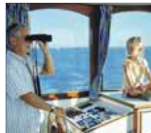
Kapitän auf Zeit – führerlos durch das blaue Paradies