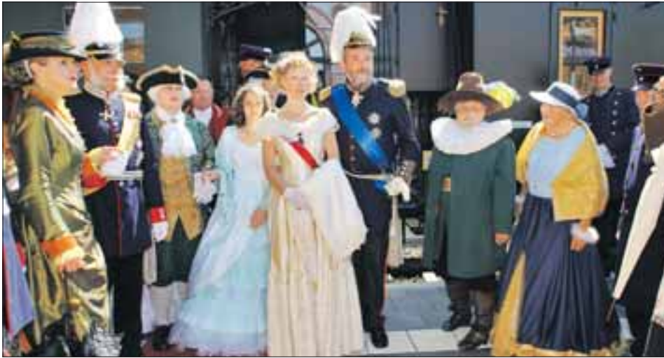
Altertümlisches Kunsthandwerk, opulente Kostüme und Einblicke in das frühere Leben am Hofe: An dem offiziellen Festwochenende vom 4. bis 6. Juni anlässlich des 850. Jubiläums der Landeshauptstadt Schwerin findet auch das 11. Schweriner Schlossfest statt. Das historische Spektakel entführt Gäste in das 19. Jahrhundert, als Großherzog Friedrich Franz II. von Mecklenburg-Schwerin die Geschicke der Region lenkte.

850. Jubiläumsjahr ist der Veranstaltungsplan wieder mit jeder Menge Höhepunkten gespickt. Ich bin ja nicht der Tourismuschef der Stadt, habe aber ein vitales Interesse daran, dass viele Hamburger in den Zug steigen und infahren. Deshalb habe ich mal im Internet unter www.schwerin.com nachgeschaut, was so alles geboten wird.