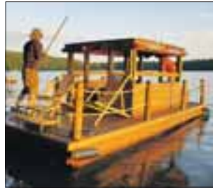
Urlaub auf dem Floß: spartanisch aber erholsam

Zu Beginn der Reise auf den Brettern, die nicht die Welt aber Erholung bedeuten, erhält der Floßkapitän eine Wasserwanderkarte der Umgebung. So kann die Truppe selbst entscheiden, wohin es gehen soll.