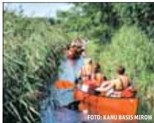
Mit dem Canadier durch die schmale Schwaanhavel

Wir starten unsere Tour von der Kanu Basis Mirow. An den nächsten fünf Tagen wollen wir 59 Kilometer paddeln. Unser Ziel Rheinsberg wäre direkt in zwei Tagen erreichbar – aber das Wasser-Labyrinth im blauen Paradies lädt dazu ein, Umwege zu fahren und an schönen Orten Halt zu machen. Doch bevor es richtig losgeht und wir die zuvor gepackten wassergeschützten Tonnen an Bord nehmen, gibt es erst einmal eine fundierte Einführung. Nur wenige Meter von unserem Startort entfernt schlängelt sich ein kaum sichtbarer Pfad durch