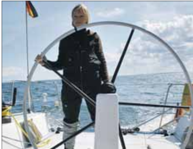
Kurs halten entlang der Ostseeküste